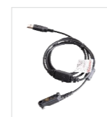
Cabo de programação USB