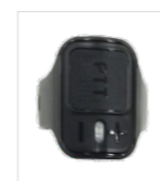
PTT de dedo sem fio