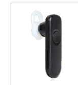
Fone sem fio